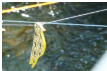
Installation Micro-bruits d'Illana Pichin, au parc municipal de Saint-Bruno-de-Kamouraska.