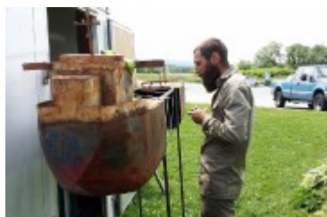
Fonderie polaire , de Mathieu Gotti, sur le site de la Maison touristique régionale du Bas- Saint-Laurent à La Pocatière.

Info : www.kamouraska.org ( http://www.kamouraska.org )