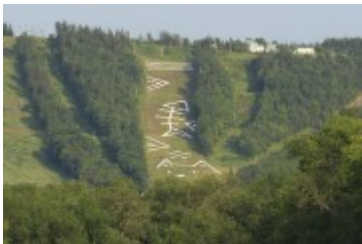
L'hiver en été d'Émilie Rondeau

Info : www.estnordest.org ( http://www.estnordest.org )